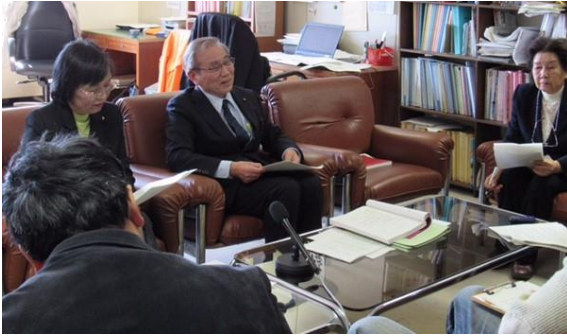
2016年2月8日 申し入れ後の記者会見（市役所内）